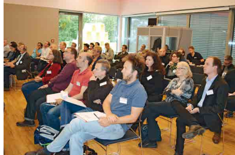
Tagungsort (AK OÖ, Jägermayrhof) und TagungsteilnehmerInnen der Linzer Konferenz